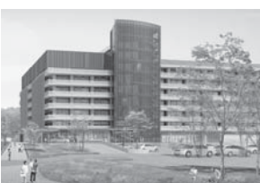
▲新市庁舎の設計外観